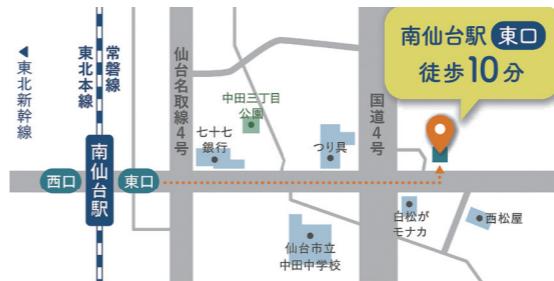
南仙台どうどう歯科クリニックの位置図

大型商業店舗や事務所、福祉医療施設などに特化した不動産活用と建設業の(株)福重企画による、新しい歯科医院「南仙台どうどう歯科クリニック」が完成、7月に開業する。不動産に付加価値を付けるという同社の強みを活かした案件で、特定建設業としての設計・施工力も発揮した。同社では、今後とも商業・事務所、福祉・医療施設などに特化した営業展開に力を入れる。